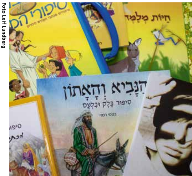
Bibelsällskapet jobbar för att bygga upp en litteraturbank och undervisningsmaterial med barn- och ungdomsböcker

BSI är engagerad att nå israeler genom olika lokala kyrkor och församlingar i satsningen ”Go and Proclaim”. Genom gatuevangelisation, konserter och andra events försöker man så frön till evigt liv – genom Guds Ord – i människors hjärtan till deras frälsning. Att evangelisera har alltid varit en hjärteuppgift för BSI.