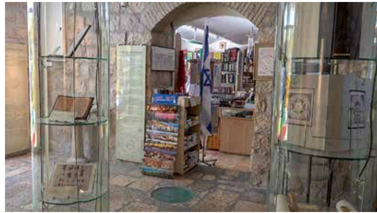
Intill butiken finns också ett mindre museum om hur Bibeln har blivit till och förmedlad till oss